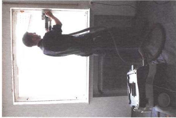
Demontage der alten Fenster durch Spezialmaschinen mit Absauganlage.