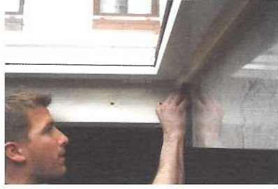
Verfugung mit PU-Dichtstoff, den sie jederzeit überstreichen können